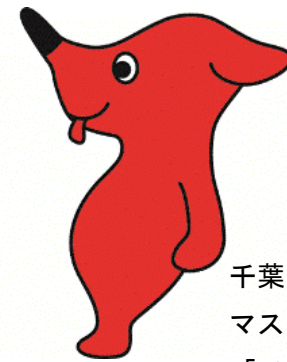
千葉県 マスコットキャラクター 「チーバくん」